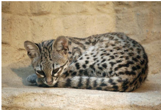
Catálogo de Biodiversidad de Colombia

Son principalmente nocturnos, se encuentra en bosques húmedos, siempre verdes, bosques maduros, secundarios y deciduos y se alimenta de pequeños mamíferos, aves.