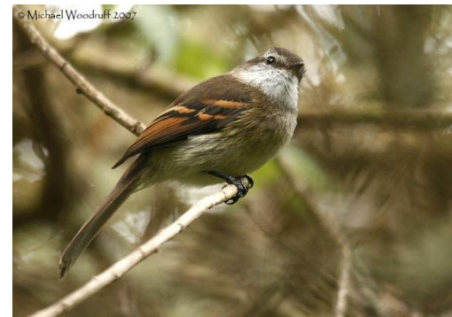
Catálogo de Biodiversidad de Colombia

De tamaño relativamente mediano, bastante común en todo el país, especialmente en la Sabana de Bogotá. En general forrajeador activo, comúnmente en grupos de más de un individuo, se caracteriza por tener una notoria garganta blanca y barras alares de color canela, a la vez de una cola relativamente larga.