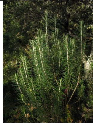
Catálogo de Biodiversidad de Colombia

Esta especie se encuentra en Colombia en la parte norte de los Andes y en Venezuela, se presenta en áreas de páramo y es un arbusto de 3 m de altura, con capitulescencias terminales de flores color blanco.