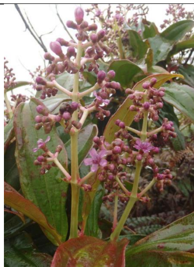
Catálogo de Biodiversidad de Colombia

Esta especie se encuentra desde bosque altoandino hasta áreas de páramo. Esta planta es un arbusto de 1.5 m de altura. Se caracteriza por tener la haz verde oscura y el envés púrpura, hace parte del bosque Secundario.