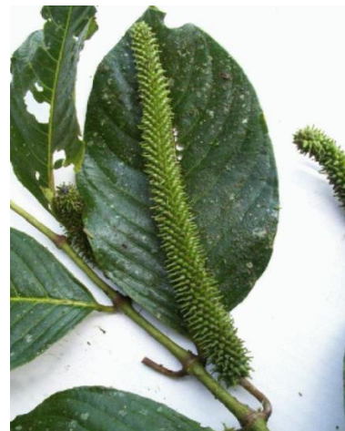
Catálogo de Biodiversidad Universidad Javeriana

Arbusto de 2-6 m, laxamente ramificado, tallos y ramas de color verde pálido a magenta en las partes jóvenes, con nudos discretos; los entrenudos de 6-10 cm de longitud y con glándulas de color amarillo-pálido a translúcidas; ápice del vástago emergiendo de entre el profilio y libre de a base foliar en los nudos que portan las inflorescencias.