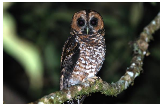
Wikiaves Universidad Icesi

Esta especie es un ave poco conocida, se encuentra en selvas húmedas de montaña y ha sido registrada en las tres cordilleras del país. es una especie de ave rapaz nocturna.