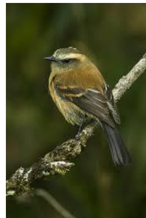
Wikiaves Universidad Icesi

Esta especie mide 11 cm aproximadamente, tiene gorra oscura, pero poco contraste con la espalda; rabadilla clara contrastante. Es una especie que habita en selva húmeda y bordes enmalezados. Se encuentra a menudo en la parte rural de la Sabana de Bogotá, sobre árboles bordes de potreros, cercas vivas, alisos y matorrales nativos.