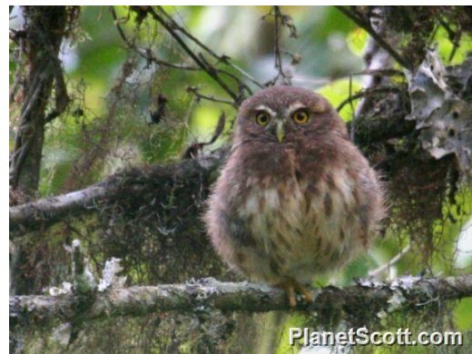
Catálogo de Biodiversidad de Colombia