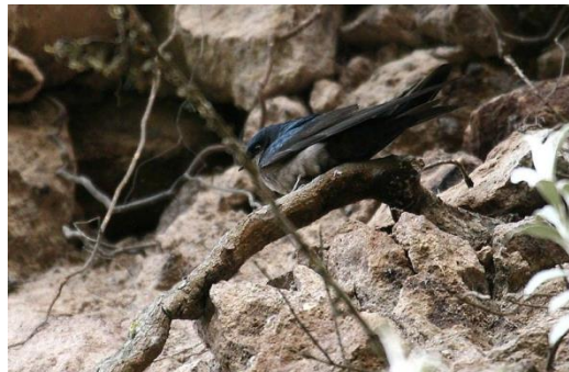
Catálogo de Biodiversidad de Colombia

Es una especie con un rango de distribución muy amplio. Se encuentra en Bolivia, Colombia, Ecuador, Perú y Venezuela. Generalmente se le puede observar sobrevolando potreros, cultivos, parques, humedales y otras áreas abiertas, también en las ciudades a menudo en bandadas de hasta 100 individuos o más. Es la golondrina grande y oscura más común en la zona templada y suele verse negruzca en campo