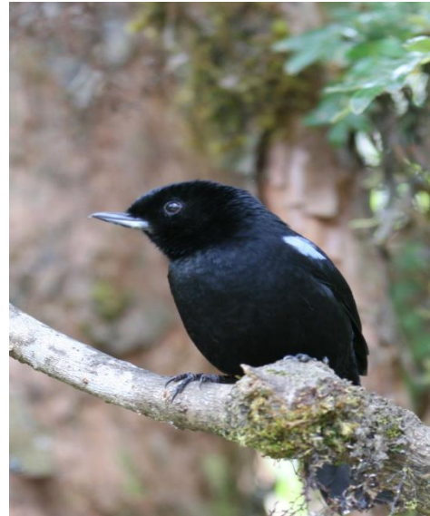
Catálogo de Biodiversidad de Colombia

Es una pequeña tangara que habita en los Andes de Suramérica. Se encuentra entre los 2700 y los 3700 msnm. Los sexos son similares, siendo negros brillantes con una mancha en el ala parche azul grisácea y como la mayoría del género Diglossa un gancho terminal en la punta de la maxila. Es bastante difícil de diferenciar de Diglossahumeralis , sin embargo el Pinchaflor Brillante presenta un mayor tamaño y un pico más robusto en comparación con esta. La especie a menudo acompaña a bandadas mixtas de aves cantoras y canta en perchas expuestas