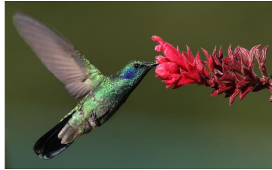
Catálogo de Biodiversidad de Colombia

Visita flores, arbustos, epífitas y árboles a la altura del arbusto de forrajeo pero suele posarse bastante alto en los árboles. Con frecuencia tienden a capturar las moscas y los mosquitos; y con menos frecuencia rebuscan follaje en todas las alturas a lo largo de los bordes