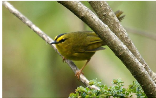
Catálogo de Biodiversidad de Colombia

con lavado verdoso. Pico negro, patas café amarillento. Los juveniles tienen el plumaje mucho más oscuro y opaco, oliva por encima, oliva con tinte amarillento por debajo, sin rayas en la cabeza. Vive en parejas o grupos familiares en matorrales altos y densos, chuscales y crecimiento secundario. Es una especie activa pero inconspicua. Tiene un amplio rango de distribución, a pesar que la tendencia de la población está disminuyendo, se encuentra en categoría de Preocupación Menor