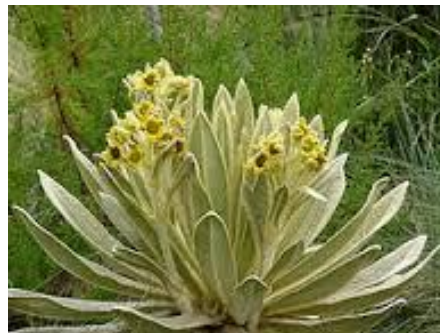
Catálogo de Biodiversidad de Colombia

El frailejón es una roseta caulescente con altura máxima de 3 m y capitulescencias de flores color amarillo.