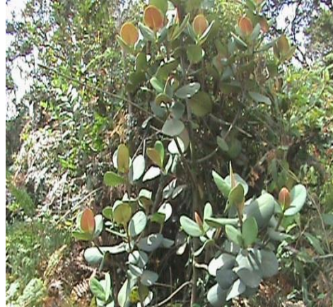
Catálogo de Biodiversidad de Colombia

Árbol ornamental, apto para parques y jardines.