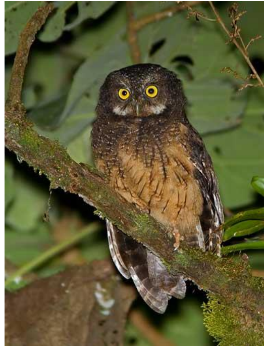
Wikiaves Universidad Icesi

También presenta barrado estrecho oscuro en las plumas de vuelo y la cola. Tiene una banda estrecha de color blanco en la garganta, pecho de color café oscuro y vientre ante leonado con pocas barras y estriado oscuro. Los jóvenes son de color gris anteado pálido con la coronilla, el manto y las partes inferiores barradas.