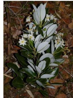
Catálogo de Biodiversidad de Colombia

Esta especie se distribuye desde México hasta Perú.