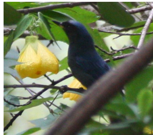
Catálogo de Biodiversidad de Colombia

Se encuentra distribuida en zonas que van desde Venezuela, pasando por la cordillera de los Andes en Colombia y hasta el extremo noroccidental en Perú. Su cuerpo es negro lustroso con la rabadilla gris oscuro y una mancha gris-azulosa contrastante sobre los hombros. Estas aves tienen un pico recurvado y con un gancho marcado que los convierte en especialistas “roba néctar”. A esta ave se le observa en bordes de bosque y en áreas abiertas de jardines y parques. Consume semillas, insectos y principalmente, néctar que extrae de las flores. Vive solo o en parejas y es bastante territorial, bien sea defendiendo individualmente su territorio establecido, o