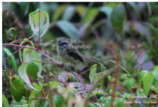
Registros Ecológicos de la comunidad Ecoregistros.org

Su hábitat natural son los bosques de montaña en climas tropicales o subtropicales.