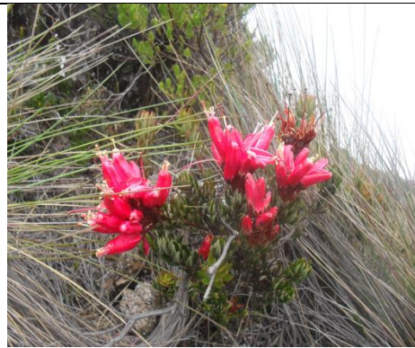
Catálogo de Biodiversidad de Colombia

Esta especie se distribuye desde Venezuela hasta Perú, se encuentra en áreas de páramo y es un arbusto de 1.5 m de altura de flores color rosado, pegajosas con estambres color crema.