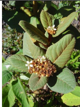
Catálogo de Biodiversidad de Colombia

Esta planta se registró en Colombia en el departamento de Cundinamarca, se encuentra en áreas de páramo, es un arbusto de 1.5 m de altura, con flores de tonalidades del verde claro al crema