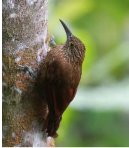
Registros Ecológicos de la comunidad Ecoregistros.org

Mide 30 cm de longitud y pesa entre 120 y 140 g. Presentan píleo color marrón negruzco; el dorso espalda y las coberteras alares son de color castaño; la corona y parte superior del dorso tienen un listado color ante; la cara presenta tonos marrón oscuro y ante, con listas postocular y malar anteadas bastante bien definidas; la barbilla y el centro de la garganta son de color blanco anteadado.