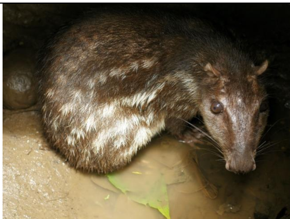
Catálogo de Biodiversidad de Colombia

graves disminuciones de esta especie. es un animal estrictamente nocturno. Durante el día tiende a permanecer en su guarida que consiste en una cueva excavada con sus uñas fuertes y los dientes incisivos, pero a veces aprovecha un tronco de árbol hueco o se apropia de la cueva de otros animales. No es un animal sociable. Comúnmente anda solitario, pero en ocasiones puede verse la hembra con su cría.