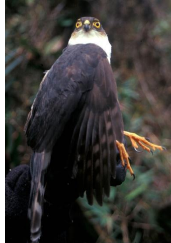
Catálogo de Biodiversidad de Colombia

Sus presas y hábitos alimenticios son poco conocidos, pero ha sido reportado persiguiendo aves desde una percha oculta, como lo hacen sus parientes más cercanos