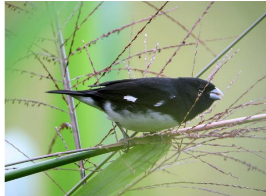
Wikiaves Universidad Icesi

Este semillero se encuentra en zonas montañosas del país entre 1500 y 2500 m de altura sobre el nivel del mar.