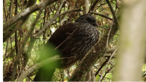
Registros Ecológicos de la comunidad Cerros Orientales Bogotá

Elaboran el nido en los árboles con ramas y hojas, donde la hembra pone dos huevos. Los polluelos nacen aproximadamente en el mes de marzo.