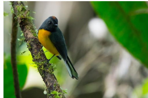
Wikiaves Universidad Icesi

Esta especie se encuentra en las tres cordilleras a altas elevaciones entre 2400 y 3400 m. Esta ave es conspicua, activa y constantemente abre la cola en abanico y entrea bre las alas para espantar insectos que atrapan en persecuciones aéreas. Su nombre significa devorador de moscas ornamentado.