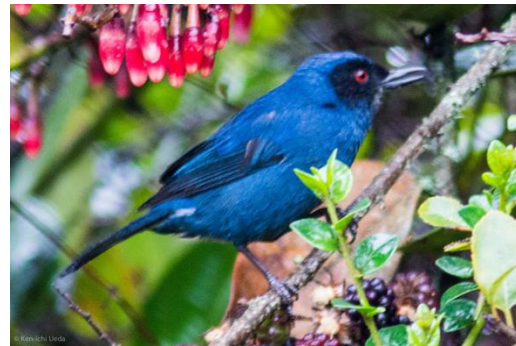
Catálogo de Biodiversidad de Colombia

Es fácil de diferenciar por el rojo de sus ojos y su tamaño, grande relativo a los demás. Su pico es mediano, largo y recurvado con un gancho al final, lo cual lo hace un especialista para extraer el néctar de las flores a manera de “robo”. Es azul intenso, incluso brillante si está expuesto a la luz, con la frente, la cabeza hasta atrás del ojo y la parte alta de la garganta, negro, formando una máscara. La hembra se diferencia del macho por ser más opaca. Se le puede observar solo, en parejas o en ocasiones haciendo parte de bandadas mixtas. Se alimenta de frutos y semillas en bordes de bosques o en todos