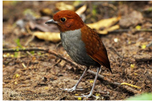
Wikiaves Universidad Icesi

Mide de 15.5 a 16.5 cm y pesa 44.8 g. Tiene iris café oscuro, pico negro y tarsos grises. Presenta cabeza, partes superiores y garganta de color café rufo uniforme, esta última con la base de las plumas gris. El resto de partes inferiores son de color gris con el centro de vientre moteado de blancuzco.