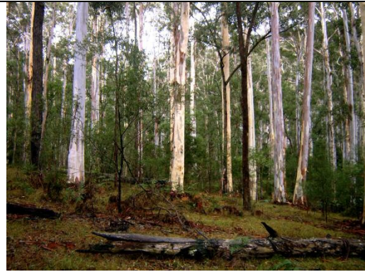
Catálogo de Biodiversidad de Colombia

Nombre científico: Hesperomeles goudotiana