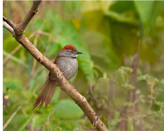
Registros Ecológicos de la comunidad Ecoregistros.org

Se le observa en parejas aunque es más lo que se les puede oír, generalmente un canto va como respuesta del otro. Buscan insectos entre los matorrales dando saltos intermitentes o sale momentáneamente a la copa de un árbol.