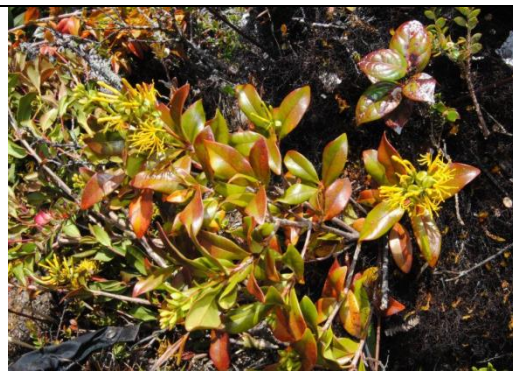
Catálogo de Biodiversidad de Colombia

a púrpura, el envés verde claro con puntos oscuros densos; nervios secundarios inconspicuos. Las ramitas se presentan ligeramente cuadradas. La corteza externamente es de color café oscura e internamente amarillenta con vetas blancas. Presenta un tronco sinuoso y la copa globosa. Es un parásito radical que tiene a recostarse en árboles vecinos. Las inflorescencias se presentan en densas panículas apicales de color verde claro en botón y crema blanco en floración.