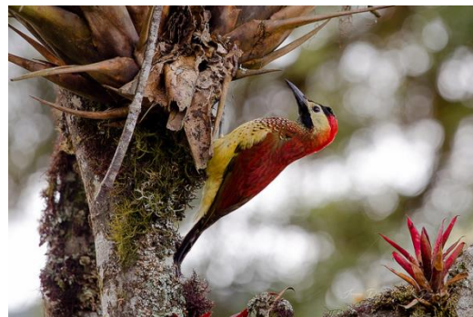
Wikiaves Universidad Icesi

Este carpintero se encuentra en bosques húmedos y muy húmedos de los Andes en donde hay abundante cobertura de musgos y epífitas. Mide de 22 a 28 cm y pesa de 85 a 97 g. Presenta pico largo y puntiagudo de color negro con culmen curvo, iris café a café rojizo y patas grises. El macho presenta coronilla y occipucio negros con las plumas ampliamente punteadas de rojo. Su nuca y lados del cuello son rojos, tiene área loreal, área alrededor de los ojos y coberteras auriculares de color amarillo pálido. Presenta región malar negra ampliamente punteada de rojo, su barbilla y alta garganta también son negras pero esta última con moteado blanco. Sus partes superiores son principalmente rojas con la base de las plumas oliva, tiene la baja espalda negra, rabadilla y coberteras supracaudales negras estrechamente marginadas de blancuzco, cola negra y plumas de vuelo café oscuro con